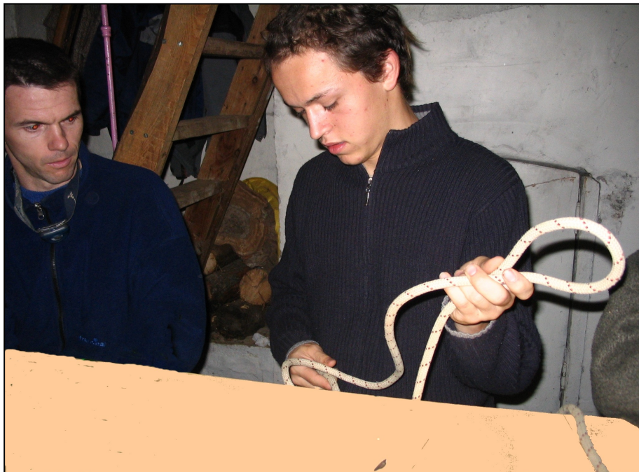
Séance d'apprentissage des nœuds à la forestière